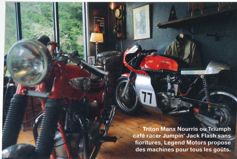
Triton Manx Nourris ou Triumph café racer Jumpin' Jack Flash sans fioritures, Legend Motors propose des machines pour tous les goûts.