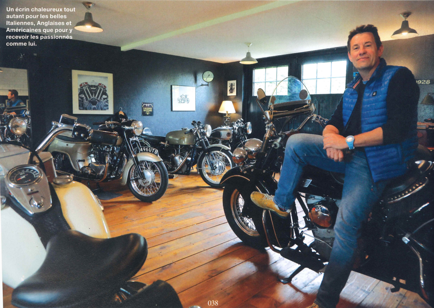
Un écran chaleureux tout autant pour les belles Italiennes, Anglaises et Américaines que pour y recevoir les passionnés comme lui.