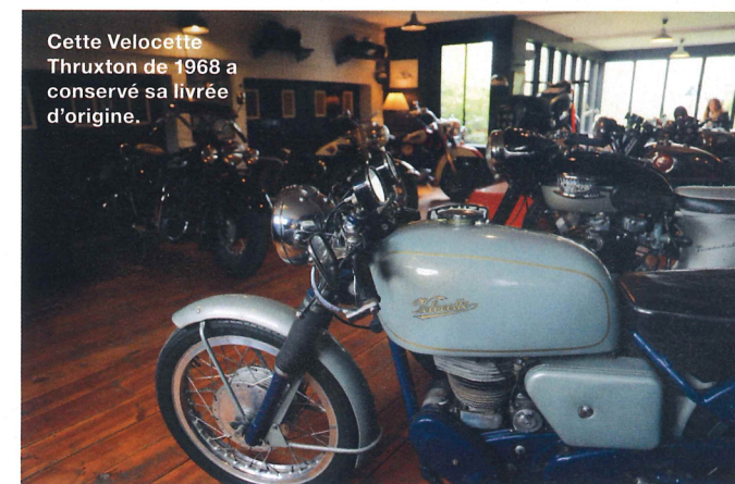
Cette Velocette Thruxton de 1968 a conservé sa livrée d'origine.